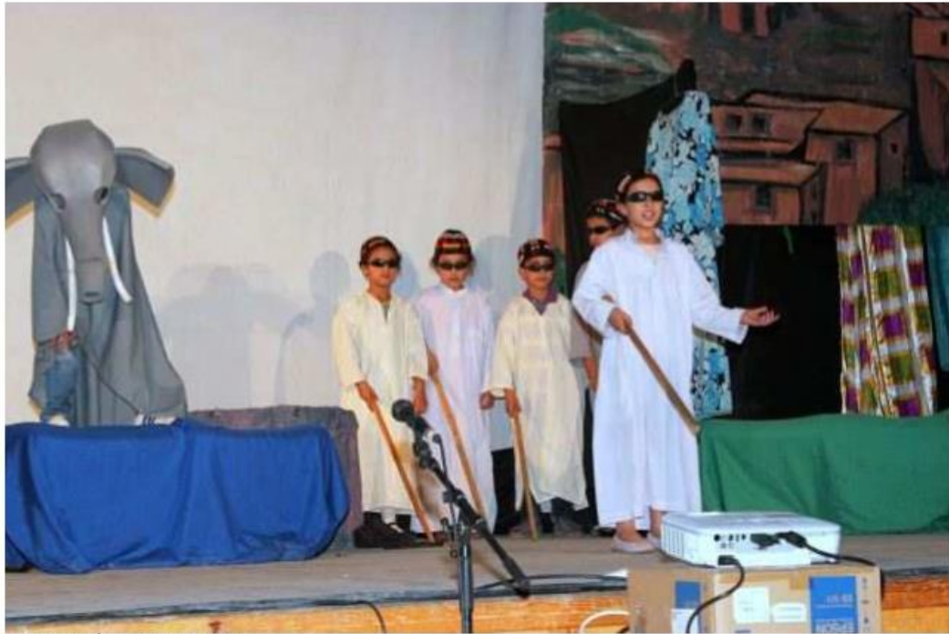
des saynètes de la vie courante