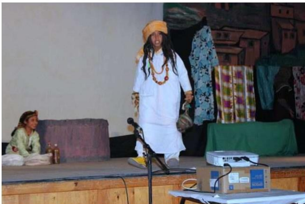
de vraies pièces de théâtre : "Les bonnes" qui traite du droit des enfants, du travail des filles dans les maisons