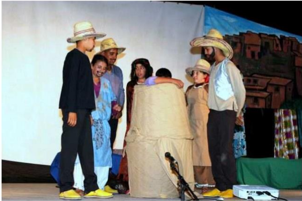
Le conte "Les 6 aveugles et l'éléphant"