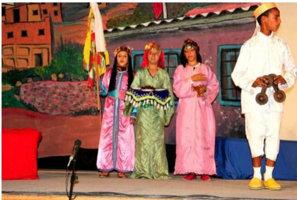
des danseurs gnaouas