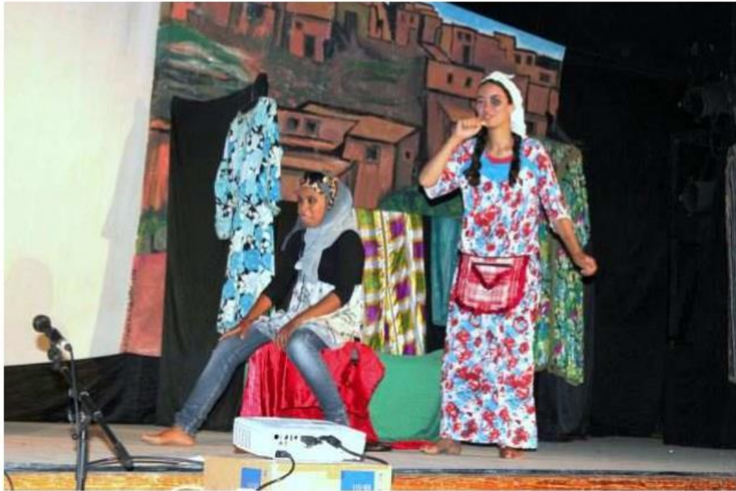
"La jarre" adaptée d'une pièce de Pirandello