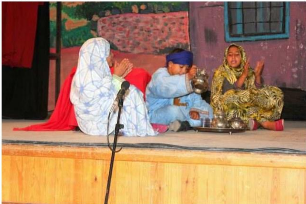
ainsi que des chants et danses traditionnels :