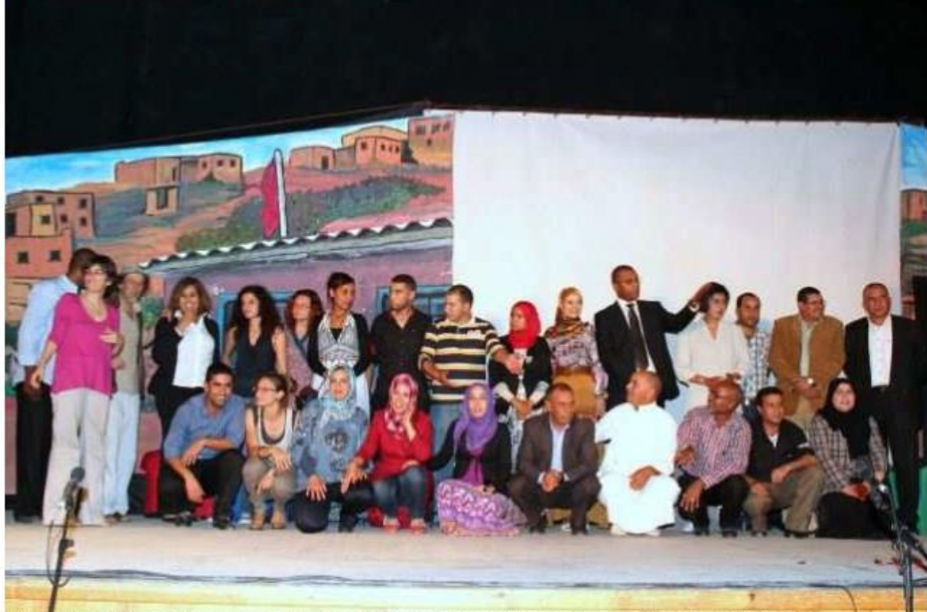
Bravo à cette belle oeuvre de l'association Kane Ya Makane : il est certain que beaucoup d'enfants bénéficiaires du projet Tanouit lui devront une bonne part de leur réussite.