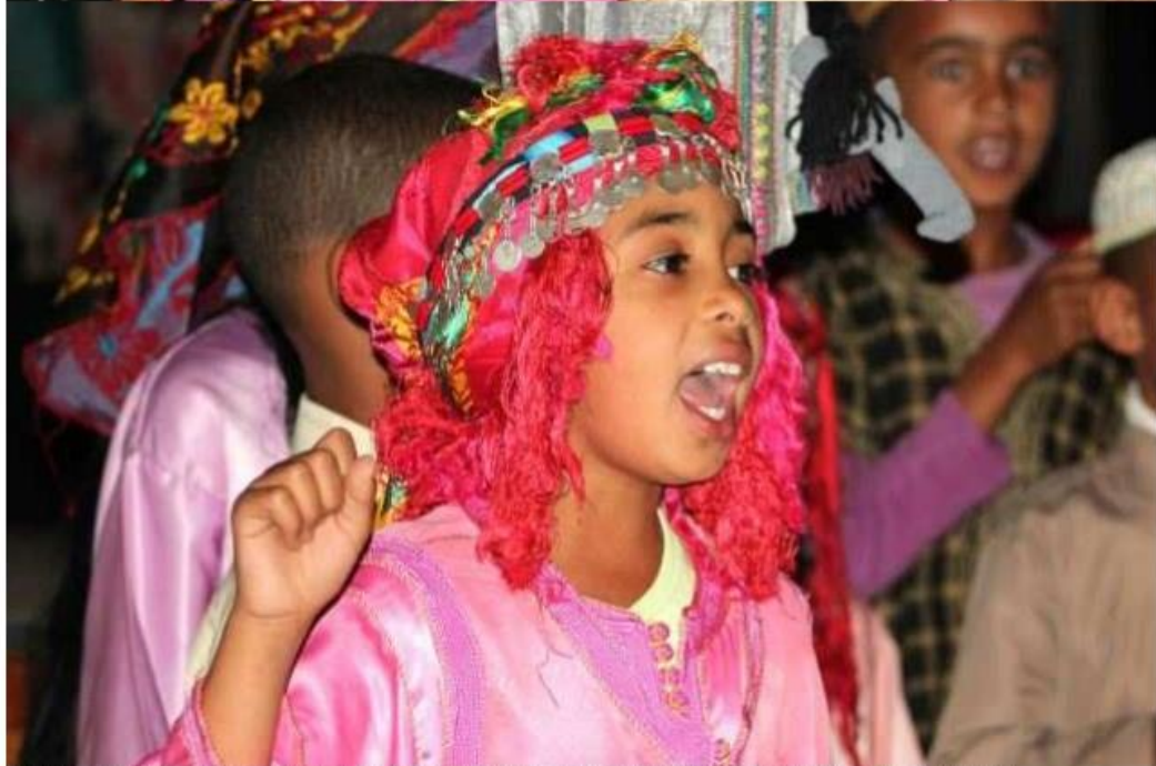
Le spectacle a réservé de belles surprises, avec de véritables acteurs chez les enfants, on a pu y voir, en particulier :