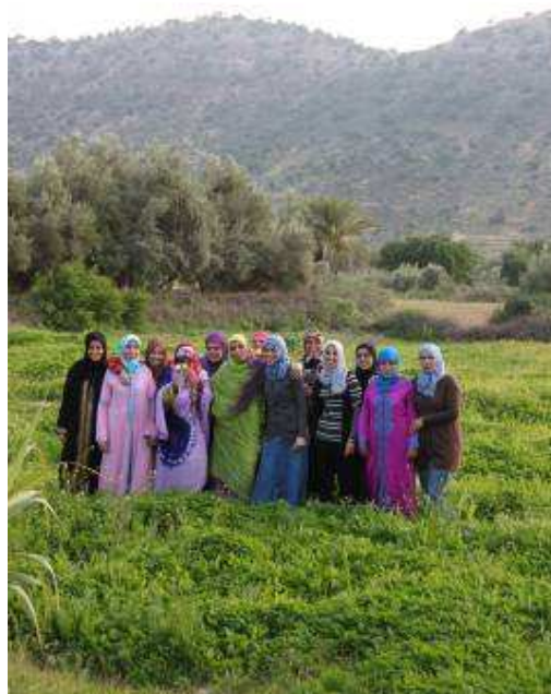
Photo des femmes prise dans le douar d'Alma

Alma : route d'Imouzzar, commune d'Aourir - région de Souss Massa Draa.