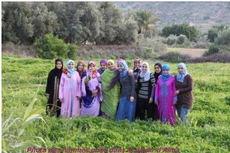
Photo des femmes prise dans le douar d'Alma

Nos sincères remerciements à toutes les personnes et institutions qui ont soutenu les femmes en achetant leurs tableaux, depuis le démarrage de ce projet.