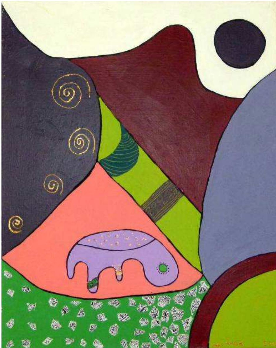
9. Fatima Abeid